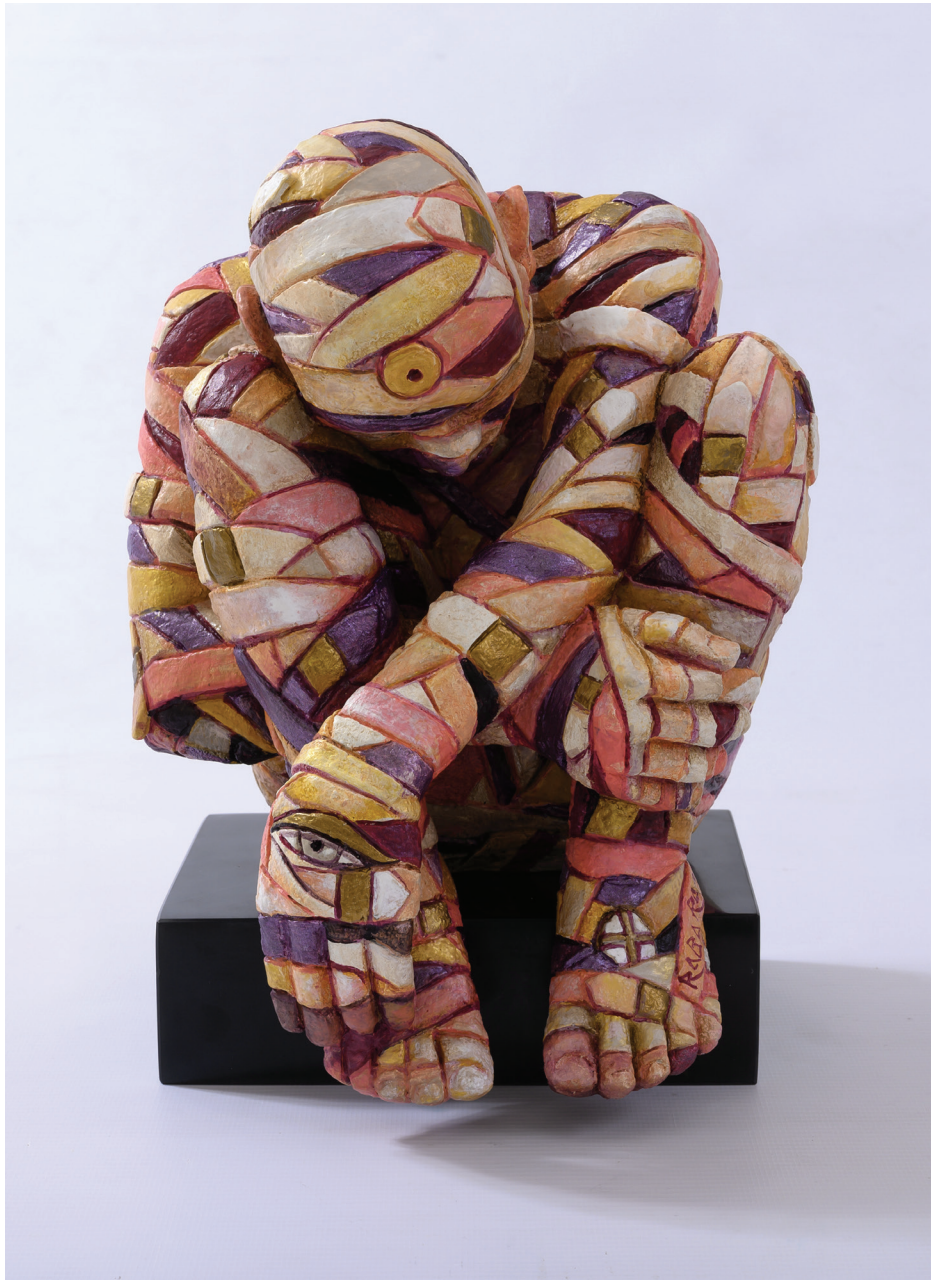
“Rigener-azione” - 2017 Bronzo dipinto (20,5 x 26 x 21,5 cm)