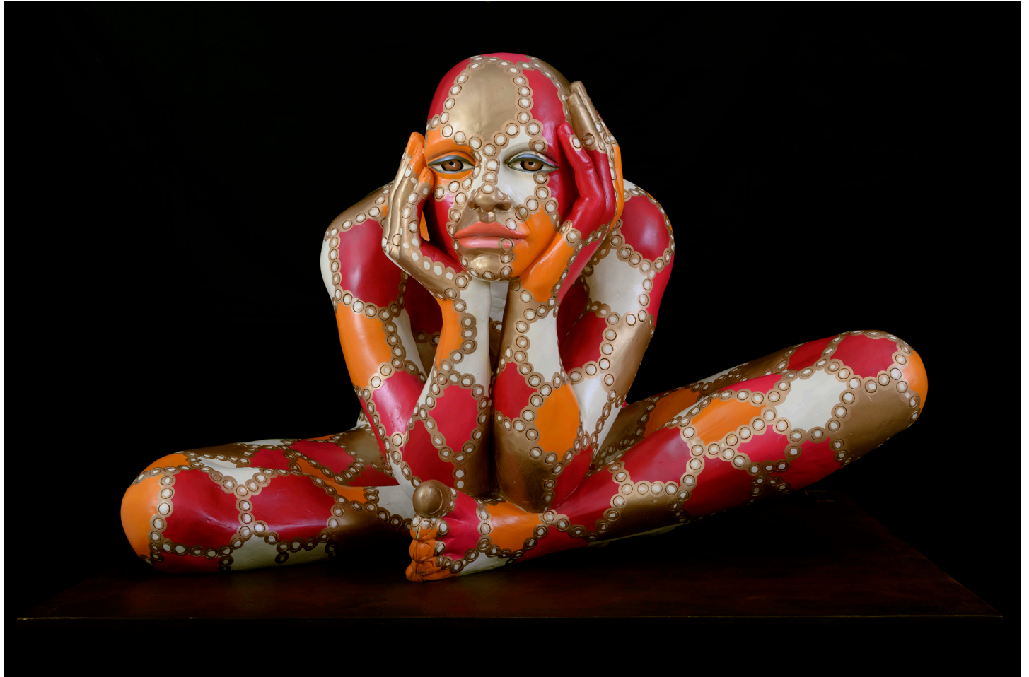
“Im-plosione” - 2006 Poliuretano dipinto (103 x 84 x 130 cm)