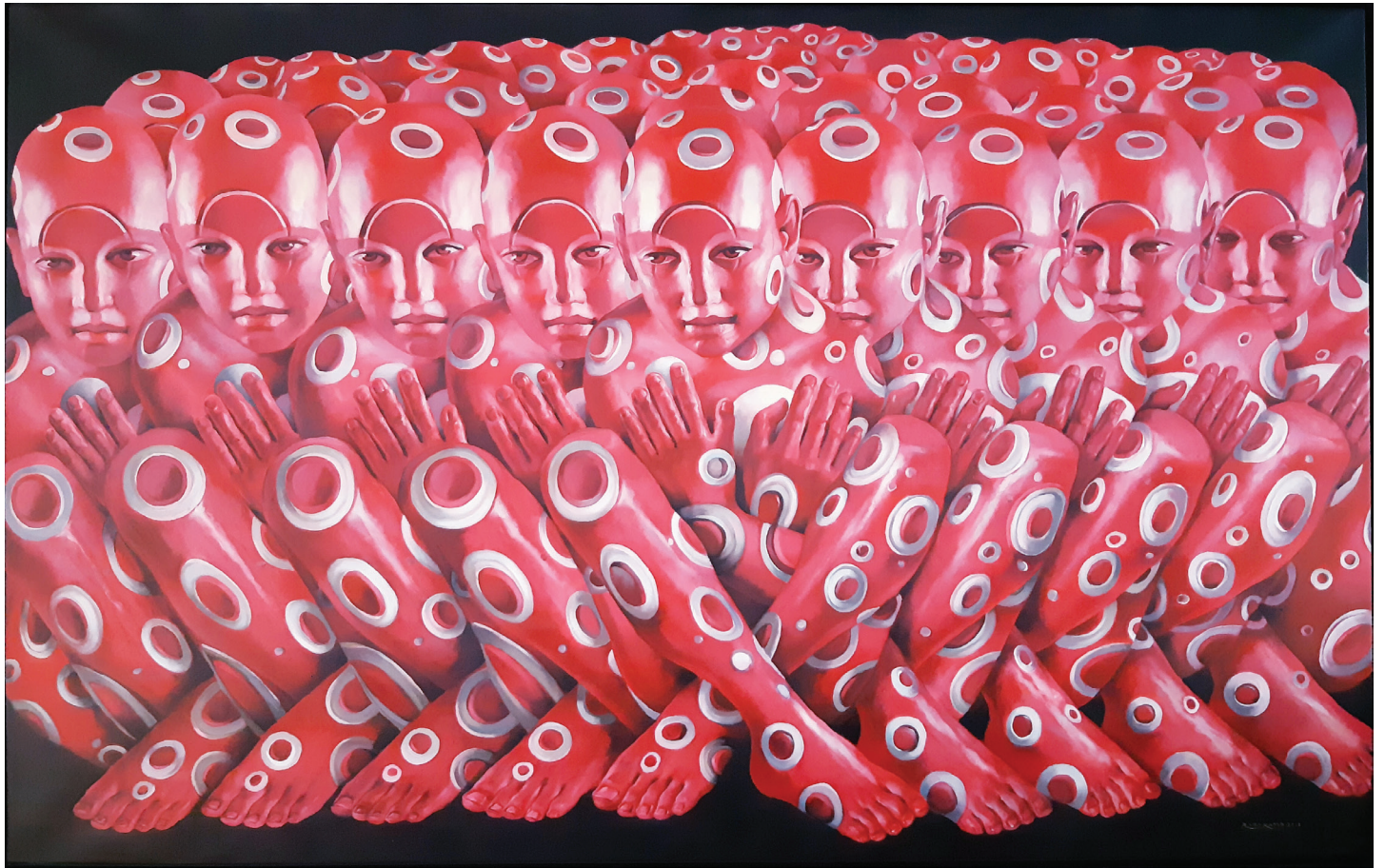
“Globulare” - 2017 Acrilico su tela (183,5 x 115 cm)