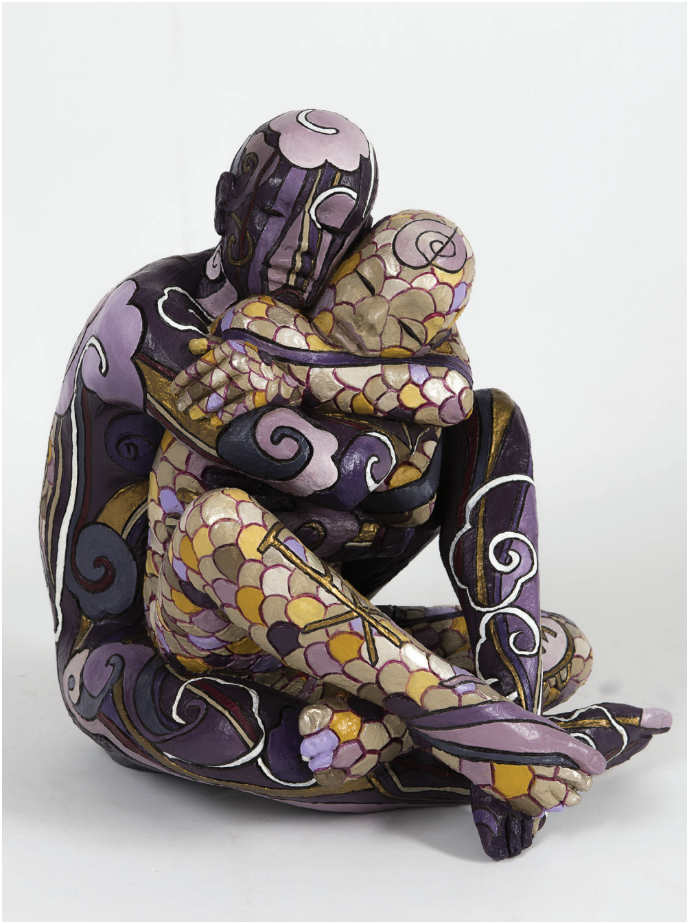
“Tantra” - 2015 Bronzo dipinto (25,5 x 34,5 x 32 cm)