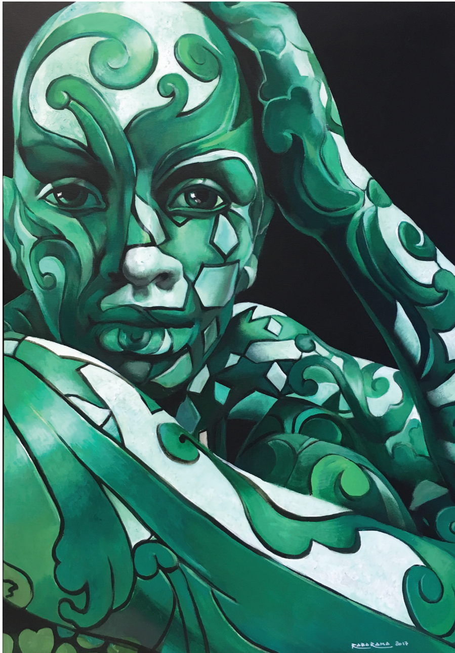
“Switch”- 2017 Acrilico su tela (70 x 99,5 cm)