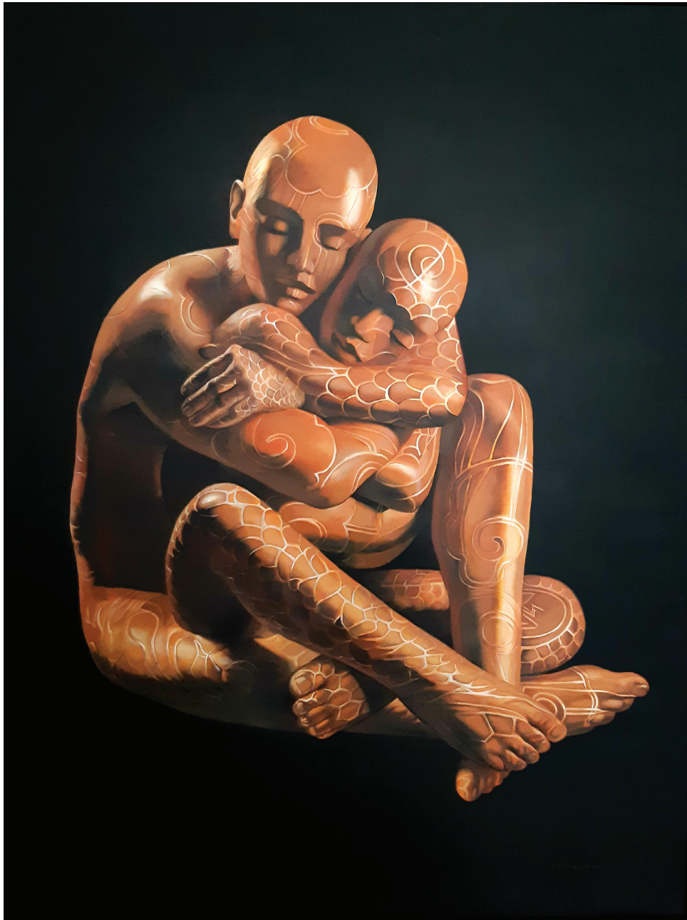
“Tantra” - 2018 Acrilico su tela (135 x 180 cm)