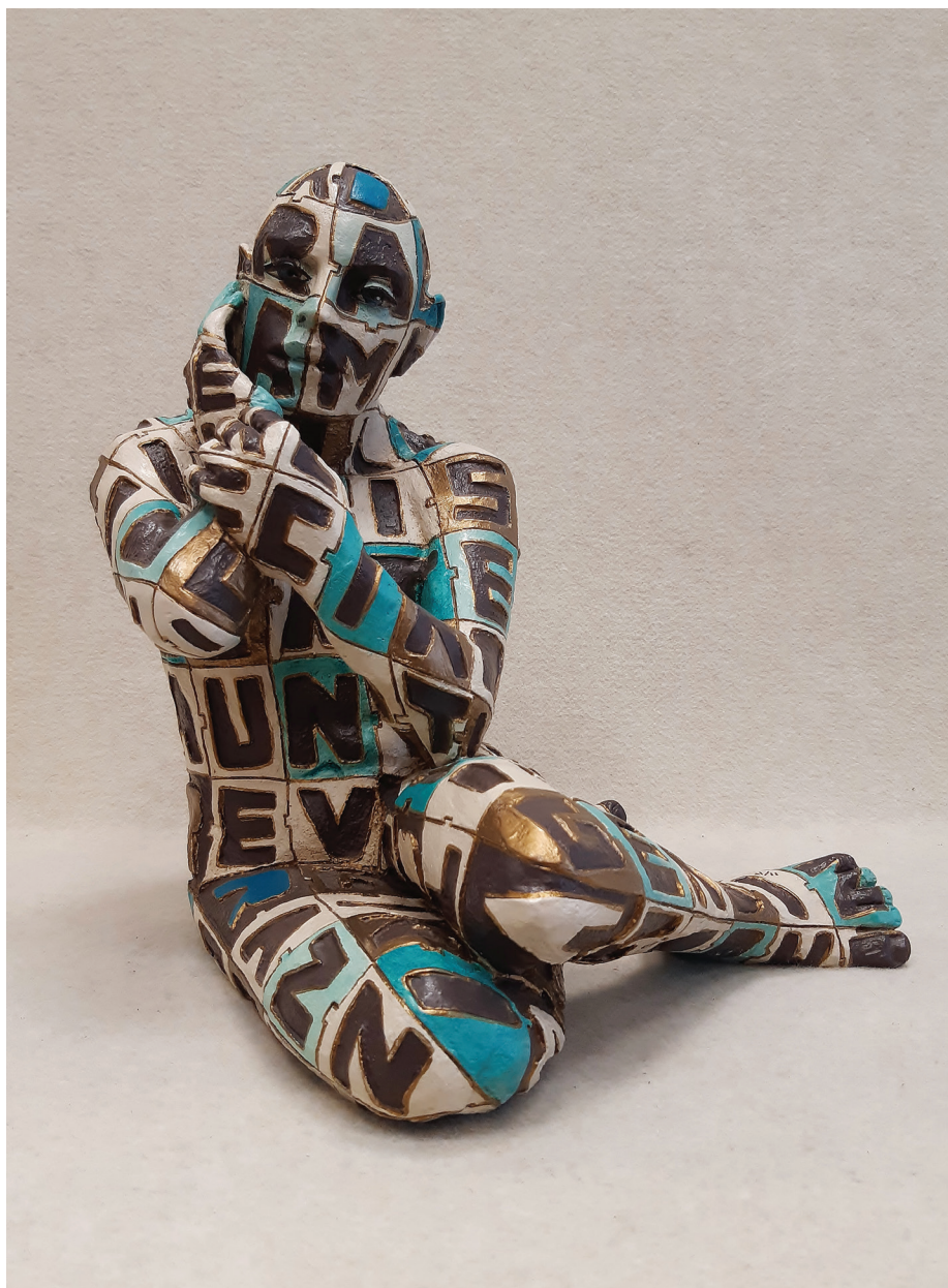
“Viaggio” - 2005 Bronzo dipinto (37 x 40 x 34 cm)