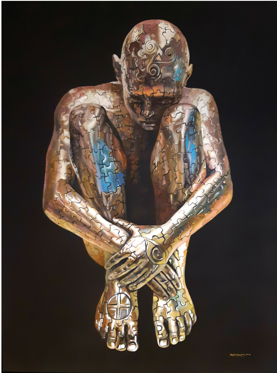
“5 - Fifth, Jnani” - 2018 Acrilico su tela (97 x 167 cm)