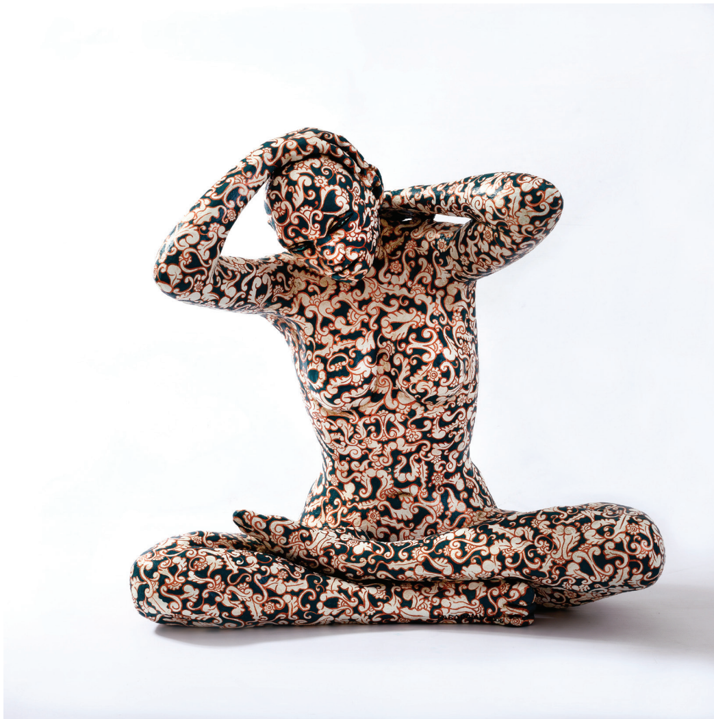
“Es-posizione” - 2006 Bronzo dipinto (49 x 48 x 28,5cm)