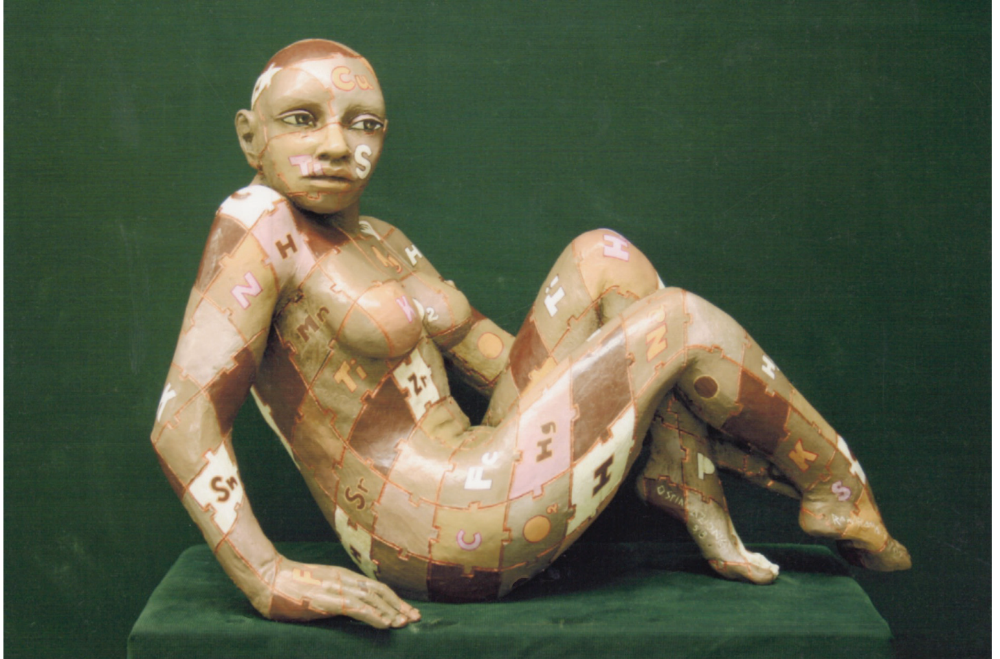
“Ostin-azione” - 2004 Bronzo dipinto (62 x 44 x 34 cm)