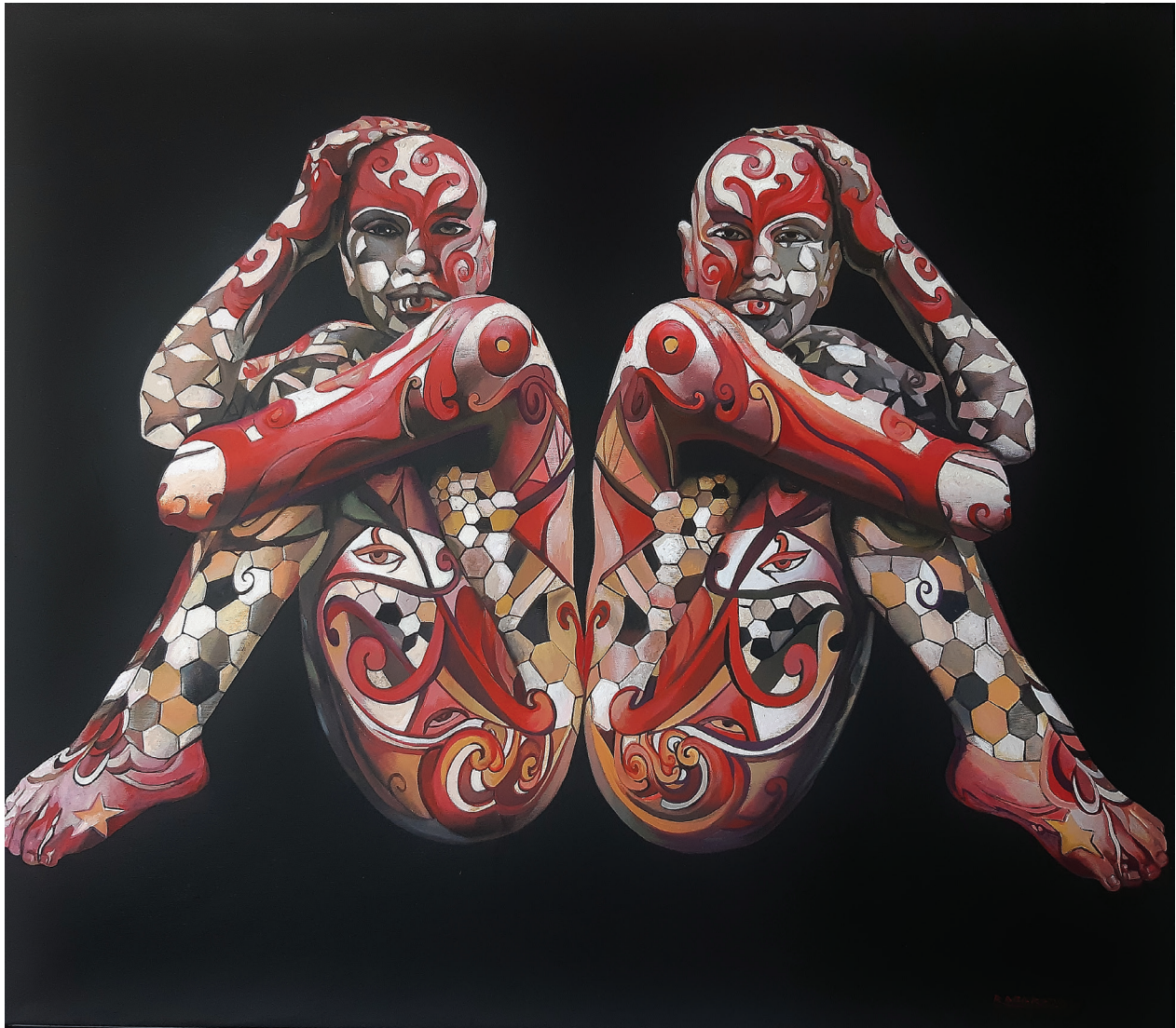
“Switch” - 2018 Acrilico su tela (105 x 92 cm)