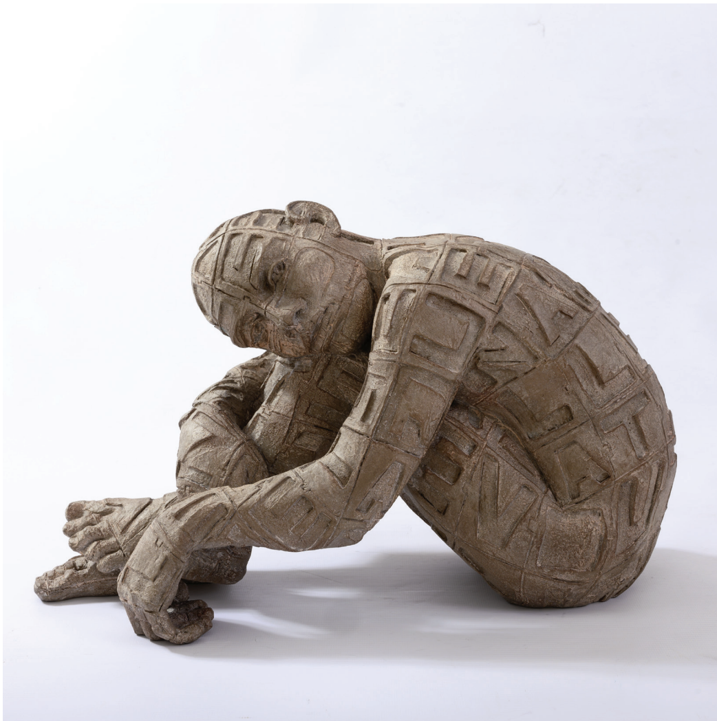
“Alicante” - 2007 Bronzo patinato (41 x 25 x 20 cm)