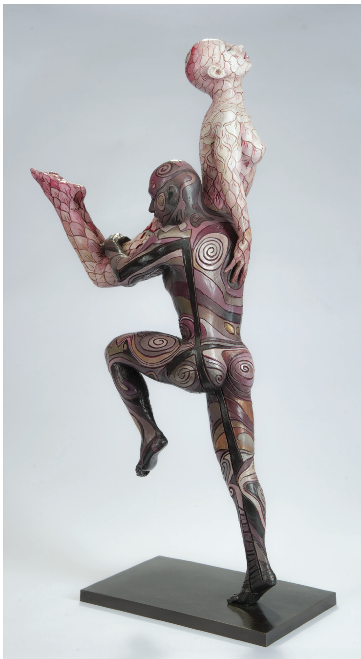
“Ananda” - 2016 Bronzo dipinto (34,5 x 77,5 x 27,5 cm)