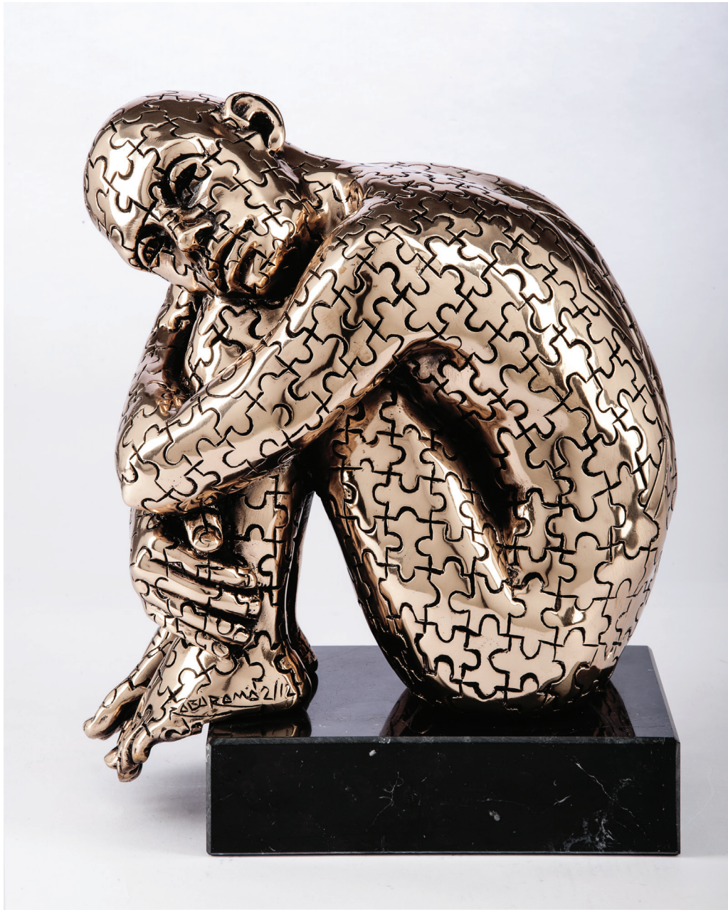
“Othilia” - 2012 Bronzo lucido (26 x 31 x 19 cm)