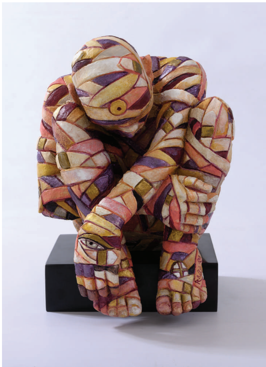
“Rigener-azione” - 2017 Bronzo dipinto (20,5 x 26 x 21,5 cm)