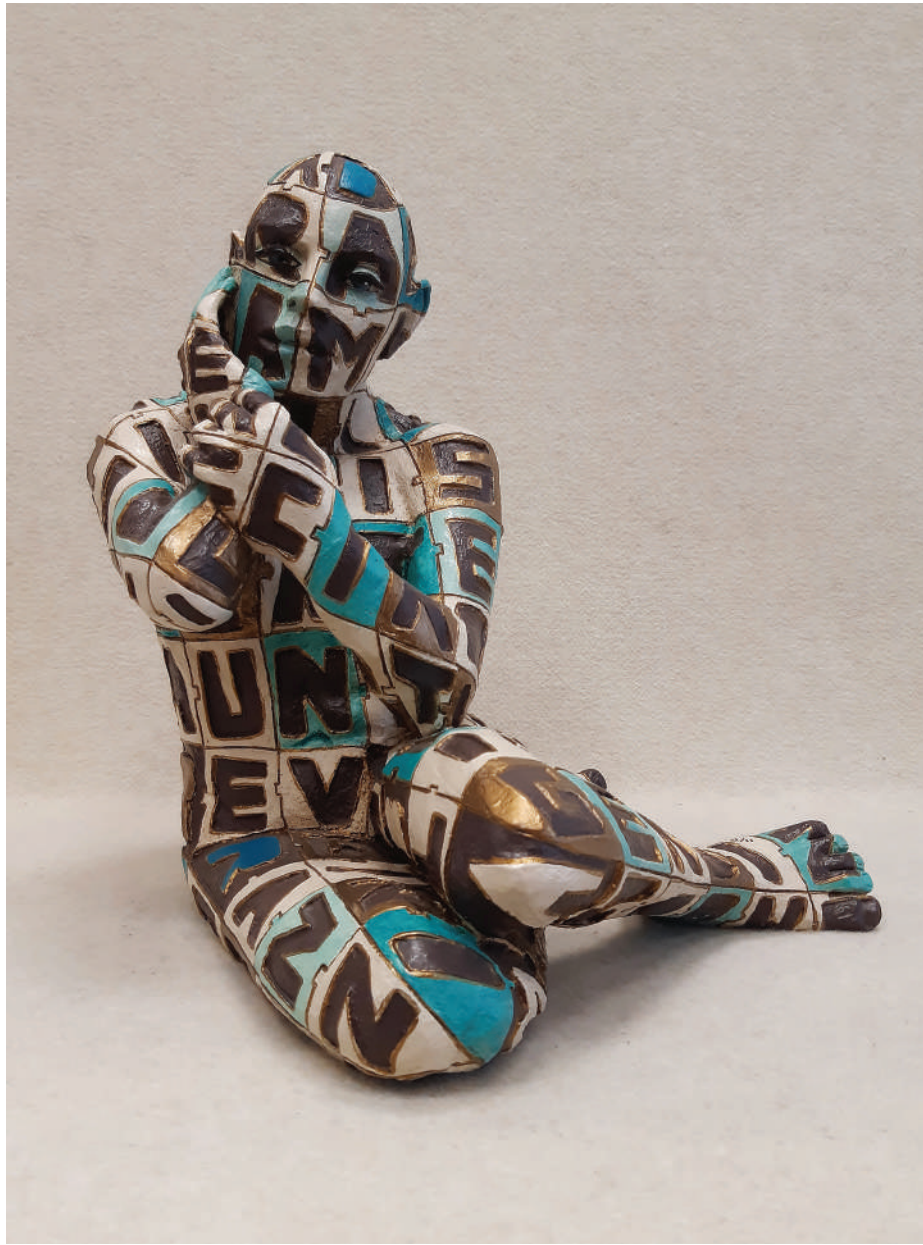
“Viaggio” - 2005 Bronzo dipinto (37 x 40 x 34 cm)