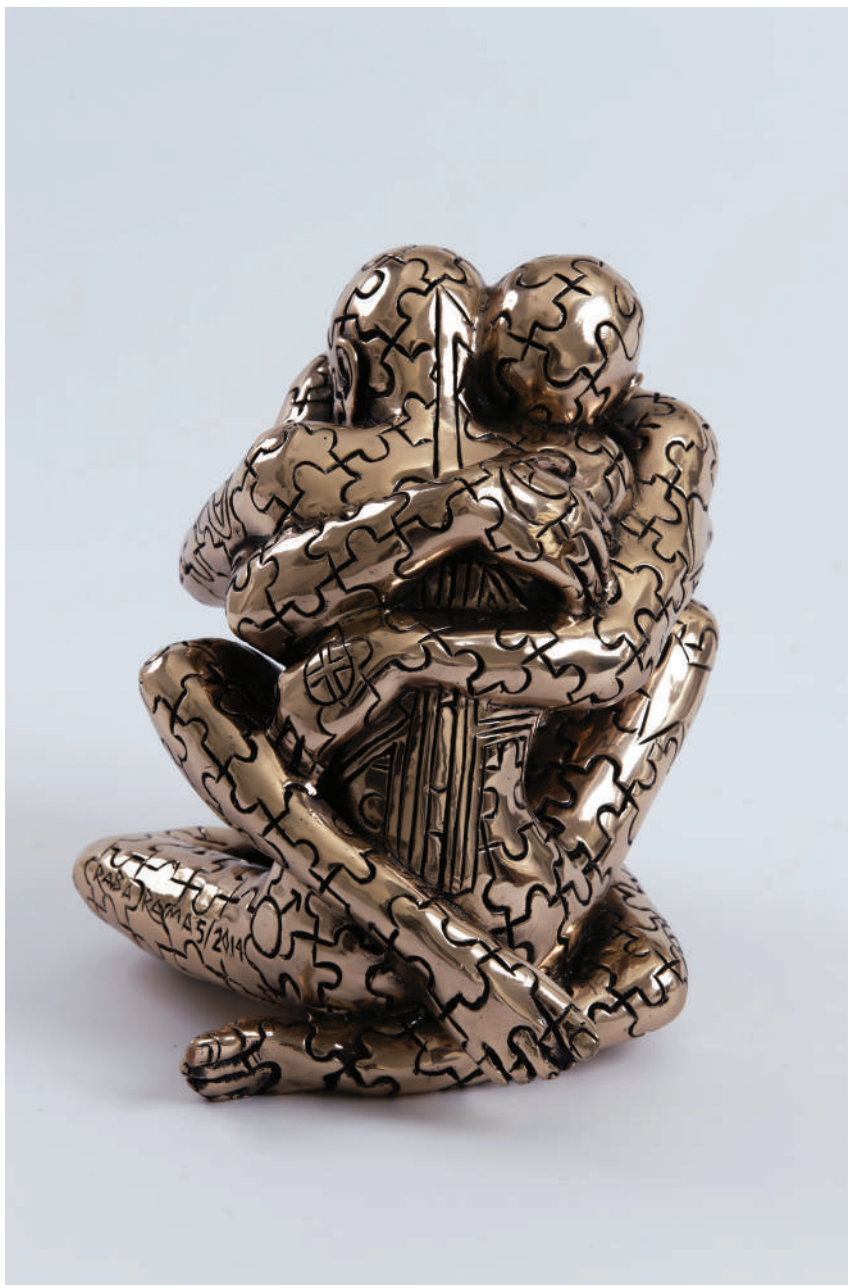
“2-Second, Flusso vitale” - 2014 Bronzo lucido (26,5 x 24 x 21,5 cm)