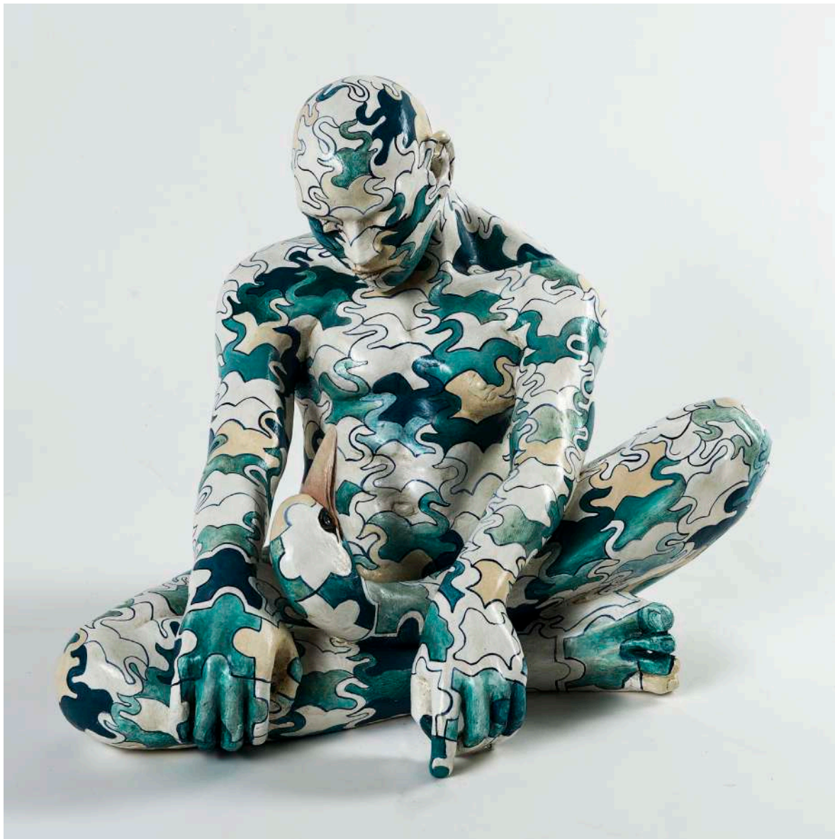
“Trans-volo” - 1997 Bronzo dipinto (36,5 x 38 x 46,5 cm)