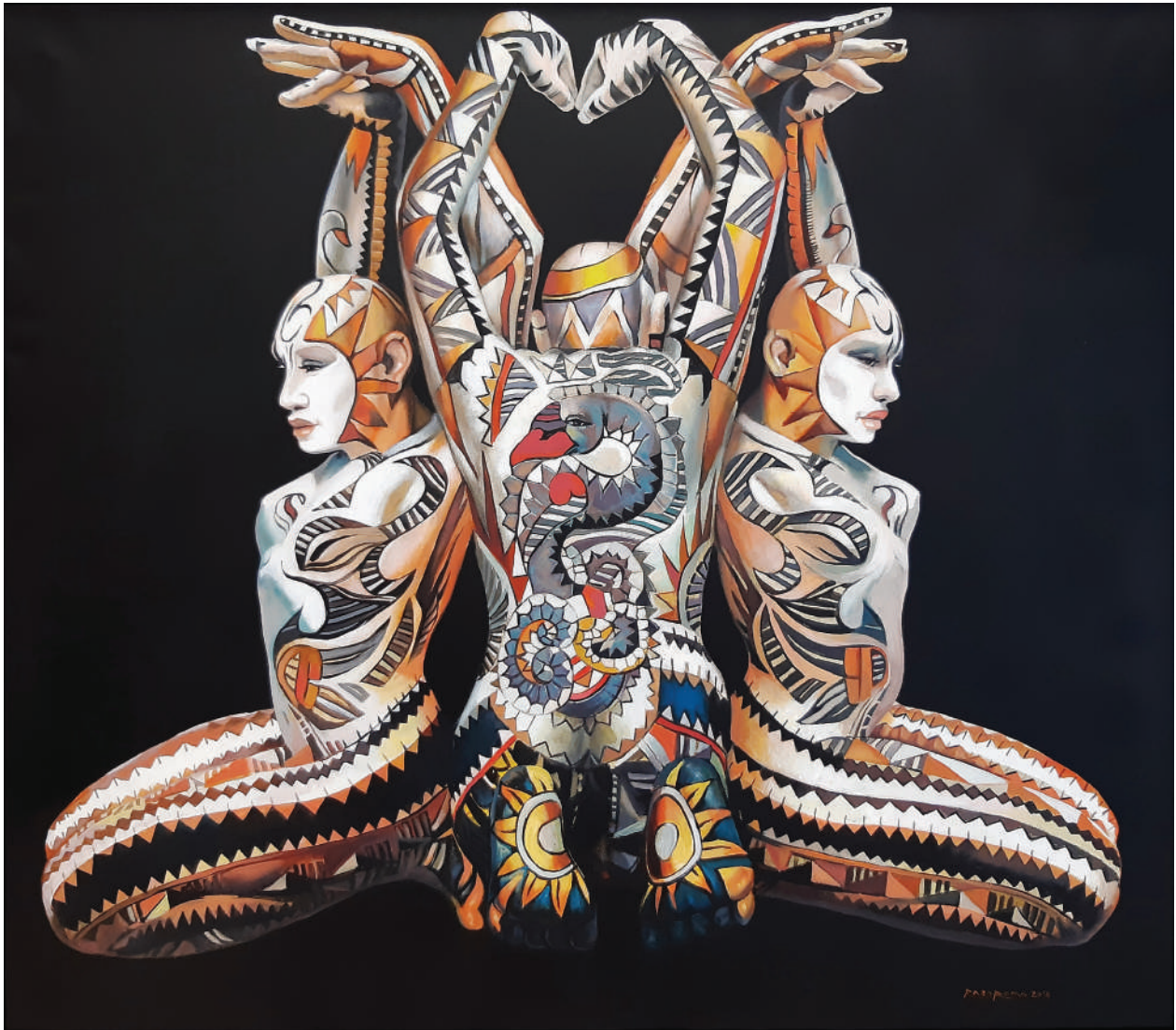
“Black swan”- 2018 Acrilico su tela (105 x 92 cm)